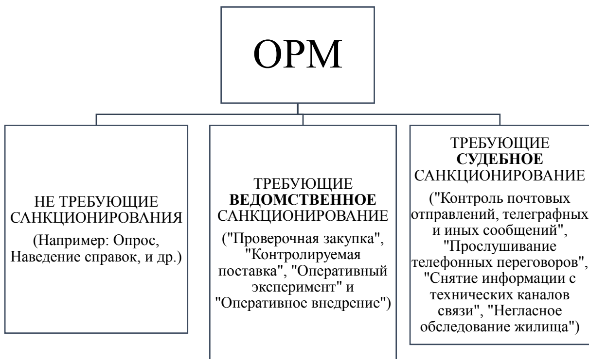
Рисунок 1.1. Классификация ОРМ

Наиболее распространенной классификацией ОРМ и кроме того определенной ФЗ «Об ОРД» является их разграничение на следующие группы: не требующие санкционирования, требующие ведомственного санкционирования, требующие судебного санкционирования. Для наглядности классификация приведена в тексте (см. Рисунок 1.1. Классификация ОРМ).