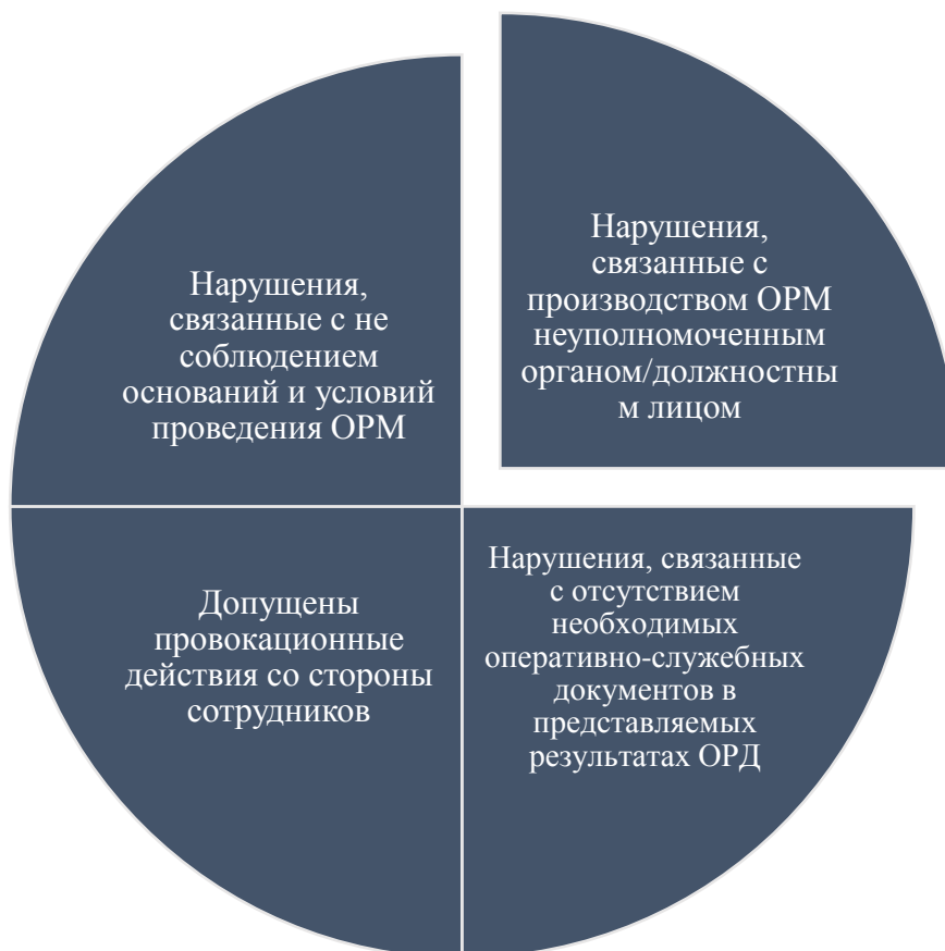
Рисунок 2.3. Результаты проведенного интервьюирования сотрудников

Подвергая анализу вышеуказанные результаты проведенного интервьюирования сотрудников, целесообразно будет каждый из пунктов детально исследовать с помощью материалов судебной практики. При поиске и изучении материалов нами была выявлена следующая тенденция: выявленные адвокатами нарушения становятся предметом их апелляционных жалоб. Так, первая подгруппа нарушений связана с не соблюдением оснований и условий проведения ОРМ. То есть данные нарушения являются следствием не соблюдения ФЗ «Об ОРД», а именно ст. ст. 6 и 7, тем самым ставится под сомнение необходимость осуществления того или иного ОРМ.